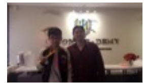
AWARD OF SUNLIFE MATH COMPETITION